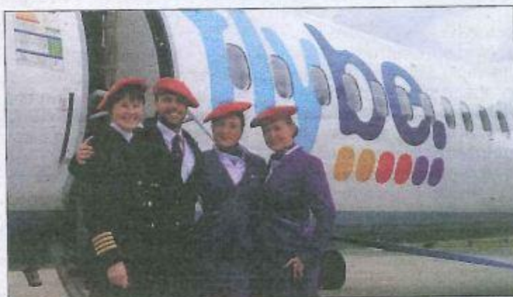
Lors du premier vol Flybe, l'an dernier, les hôtesses et stewards avaient coiffé le béret basque.

AÉROPORT La compagnie Flybe présentait hier sa nouvelle offre qui démarre en mai