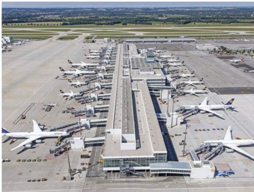
L'aéroport de Munich, l'un des hubs de Lufthansa

Rédigé par La Rédaction le Mardi 18 Décembre 2018